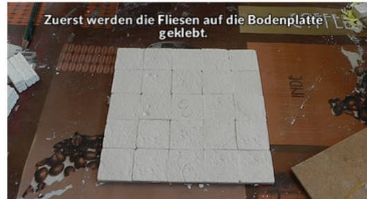
Zuerst werden die Fliesen auf die Bodenplatte geklebt.

Ausserdem ist es sinnvoll die Arbeitsplatte mit einer Folie zu belegen, damit die Bauteile während des Trocknens nicht an der Unterlage festkleben.